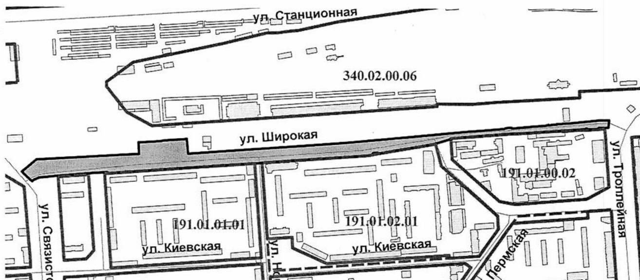
СХЕМА границ территории, предусматривающей размещение линейного объекта транспортной инфраструктуры местного значения – «Автомобильная дорога общего пользования по ул. Широкой», в Ленинском районе

Приложение 1 к постановлению мэрии города Новосибирска от 14.11.2024 № 9710